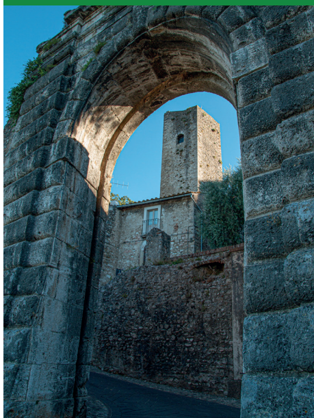
PORTA DELLA FIERA