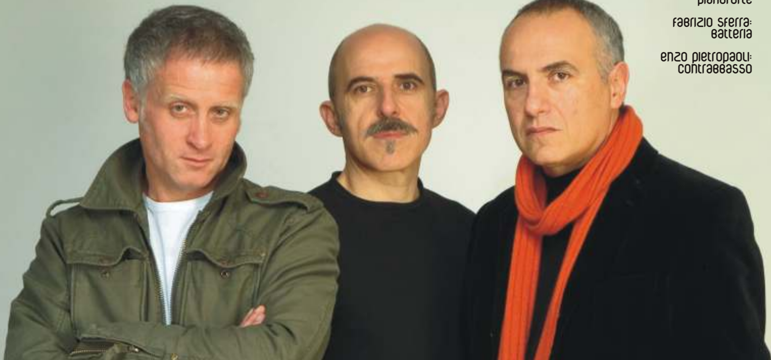
danilo rea: pianoforte